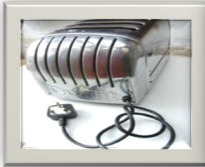
Palam 3 Pin.