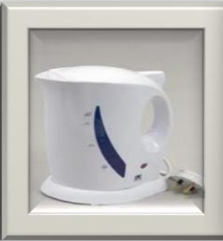
Palam 3 pin.