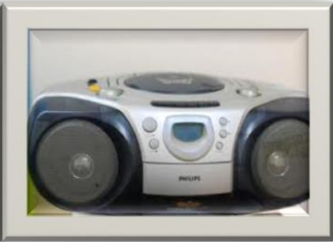
Palam 2 pin.

2.3 Sambungan peralatan elektrik tidak boleh dilakukan kepada mata lampu. Perlu menggunakan punca kuasa yang sesuai.